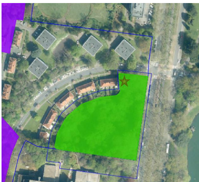
Afbakening van de beschermd landschap (groen), tevens de grens van deelgebied IB3, daarbuiten de vrijwaringszone (blauwe lijn) en situering van het beschermd geheel Le Logis-Floréal (paars) met bijhorende vrijwaringszone (blauwe lijn). De merkwaardige boom, Blauwe Atlasceder is met een ster aangegeven